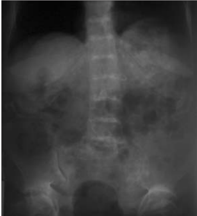
Resim 2-3. Lumbosakral AP-lateral grafi. İntervertebral disklerde kalsifikasyonla uyumlu dansite artışı ve disk mesafelerinde azalma, ankiloz.

Tespit edilmiş en eski okronozis olgusu, M.Ö. 1500 yılına ait bir Mısır mumyasıdır, intervertebral diskler, kalça ve dizlerin radyolojik ve biyokimyasal olarak incelenmesiyle tanı doğrulanmıştır. 1584 yılında Scribonius bir erkek çocuğun idrarının siyah renge dönüştüğünü rapor etmiştir. Alkaptonüri terimi ilk olarak, 1859 yılında Boedeker tarafından kullanılmıştır. 1891 yılında Wolkow ve Bauman idrarın rengini değiştiren bileşiğin homojenik asit olduğunu tanımlamışlardır (4). Okronozis terimi ilk kez 1866 yılında Virchow tarafından kullanılmıştır konnektif dokuda; kıkırdak, ligament, tendon ve geniş kan damarlarının intimasında sarı kahverengi pigment birikimini ifade eder (4-6). 1902 yılında Albrecht ve Zdarek okronozisin alkaptonüri ile ilişkisini