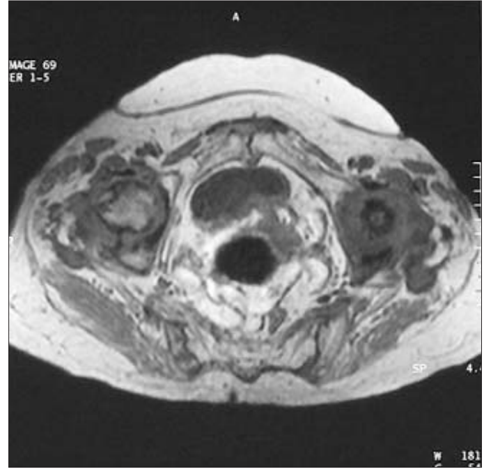
Resim 7-8. Bilateral kalça MRG'de aksiyal T1 ve T2 ağırlıklı kesitler. Solda daha belirgin olmak her iki femur başında rezorpsiyon.

sifikasyonla uyumlu dansite artışı, disk mesafelerinde daralma, vertebra korpus köşelerinde dejeneratif değişiklikler izlendi, tüm vertebralarda osteopeni göze çarpmaktaydı. Kalçanın radyolojik incelemesinde solda daha belirgin olmak üzere her iki kaput femoris formasyonlarında belirgin kayıp ve rezorpsiyon dikkati çekmekteydi. Her iki femur başı ve kollum femoriste multipl litik alanlar ve çevresinde skleroz, bilateral trokanter majörlerde kontur düzensizlikleri gözlemlendi.