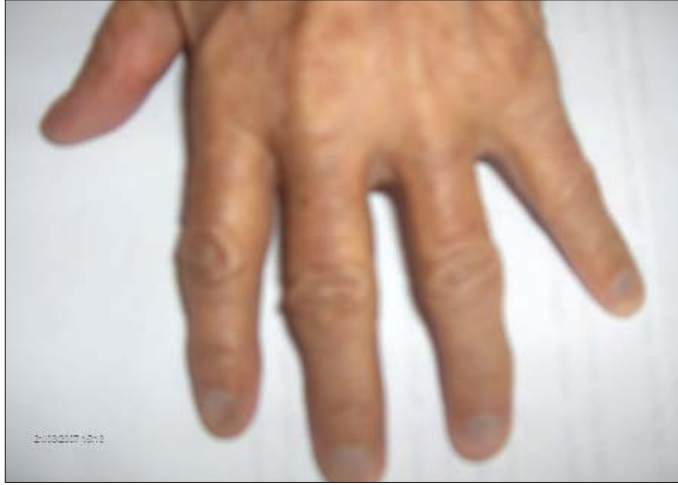
Resim 1. Tırnak diplerinde mavi-gri renk değişikliği.

Çekilen lumbosakral ön-arka ve lateral grafilerde lomber ve dorsal vertebraların korpus köşelerinde osteofitler ve dejeneratif değişiklikler, intervertebral disklerde kalsifikasyon ve disk mesafesinde azalma ve ankiloz saptandı (Resim 2,3). Pelvis ön-arka grafisinde solda daha belirgin olmak üzere, her iki femur başında ileri derecede rezorpsiyon, multiple litik alanlar ve çevresinde skleroz, asetabuler yüzeyde dejenerasyon ve bilateral trokanter majörlerde kontur düzensizlikleri gözlemlendi (Resim 4). Kalça eklemi daha iyi değerlendirmek amacıyla bilateral kalça Manyetik Rezonans Görüntüleme (MRG) tetkiki istendi. MRG sonucunda koronal (Resim 5,6) ve aksiyel (Resim 7,8) kesitlerde; her iki femur başı ve femur boynunda deformasyon, her iki koksafemoral eklem mesafesinde ekspansiv effüzyon ve sinovyal hipertrofi saptandı, her iki femur başı superiora deplase idi ve bilateral asetabuler kemiklerde belirgin deformasyon saptandı.