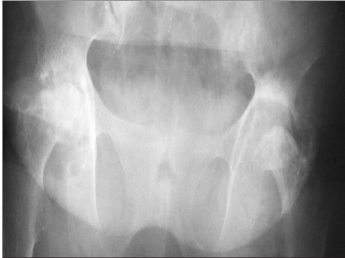
Resim 4. Pelvis AP grafi. Solda daha belirgin olmak üzere, her iki femur başında ileri derecede rezorpsiyon, multipl litik alanlar ve çevresinde skleroz, asetabuler yüzeyde dejenerasyon.

Okronozisin görülme sıklığı 1/1.000.000'dir, alkaptonürik hastaların yaklaşık %50'sinde okronozis görülmektedir (6). Alkaptonüri nadir görülen, doğumsal metabolik bir hastalıktır (8). Homogentisik asid oksidaz eksikliği sonucu homogentisik asit dönüşümü yapılamaz. Oluşan HGA baş dokusunda birikerek hastalığın klinik olarak gözlenen klasik triadına neden olur: 1) Doğumda görülen homogentisik asidüri (idrarda okside veya alkalize olmasıyla siyah renge dönüşmesi patognomiktir). 2) 20-30 yaşlarında okronoz gelişimi (homogentisik asidin konnektif dokuda birikmesi sonucu deri, sklera gibi dokularda pigmentasyon) 3) Dördüncü de-